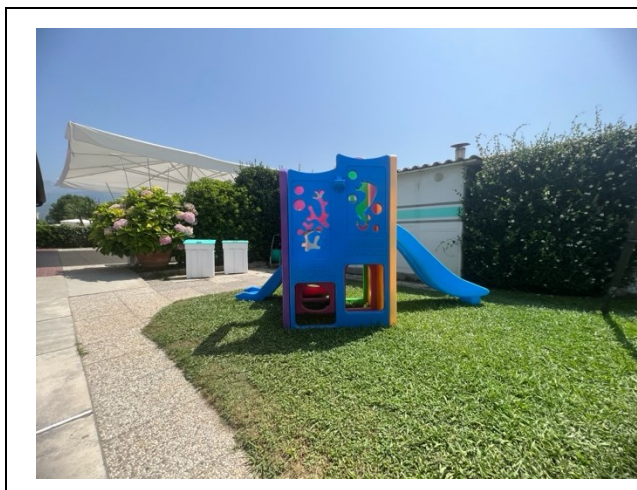
Area giochi per bambini