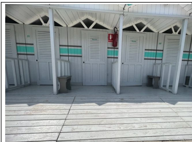
Rampa accesso locale spogliatoio